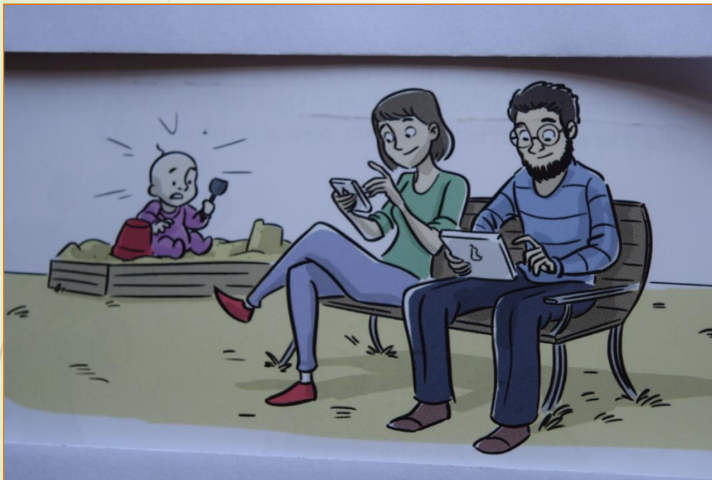
Lånt fra M. Bentzens : "Den Neuroaffektive Billedbog 1

Barnet med utryg, undgående tilknytning oplever, at omsorgspersonen måske støtter det i at udforske verden, men viser ubehag eller utryghed, når det søger nærhed.