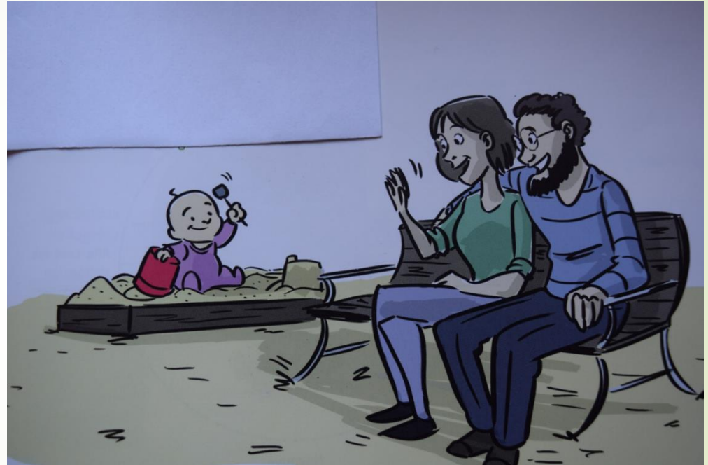
Lånt fra M. Bentzens : "Den Neuroaffektive Billedbog 1"