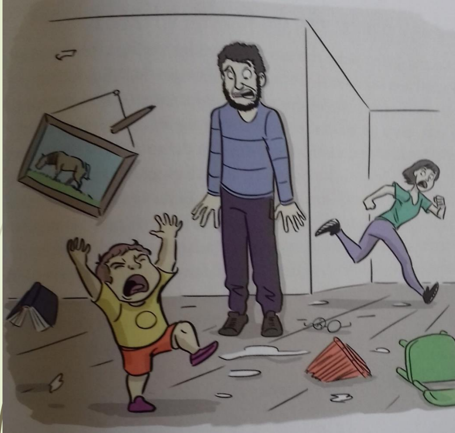
fra M. Bentzens : "Den Neuroaffektive Billedbog 1